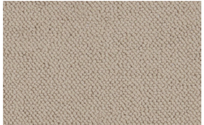
37 4m + 5m