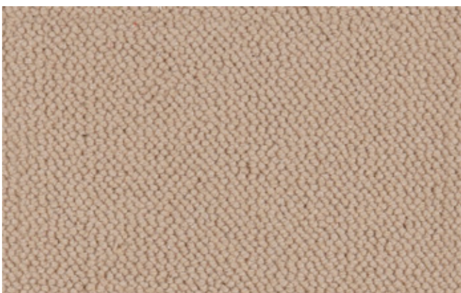
34 4m + 5m