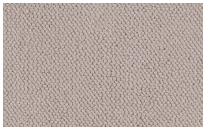
90 4m + 5m

The Associated Weavers Company reserves the right to modify the characteristics of this product while keeping the same technical properties. We strongly recommend the use of darker colours for heavy traffic areas.