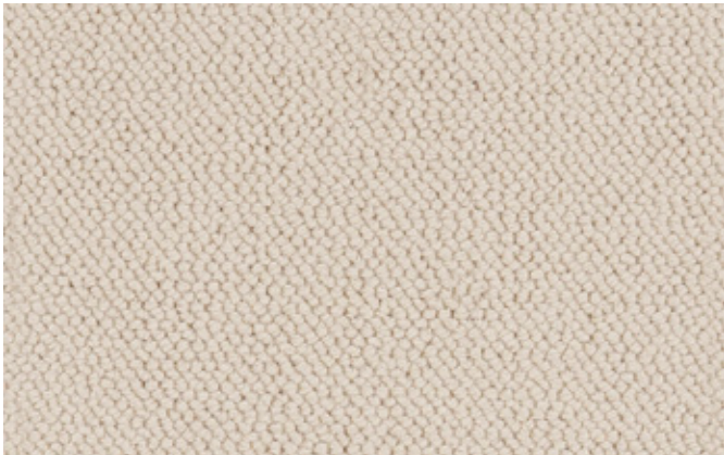
30 4m + 5m