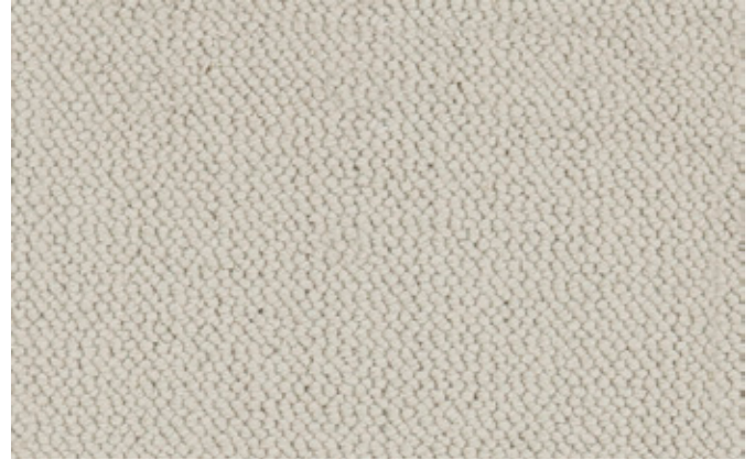
39 4m + 5m