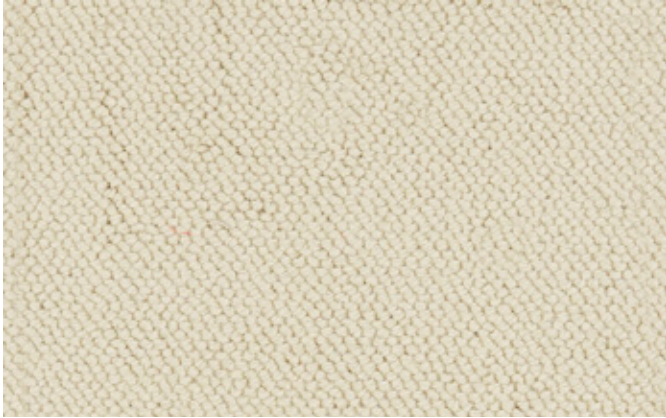
32 4m + 5m