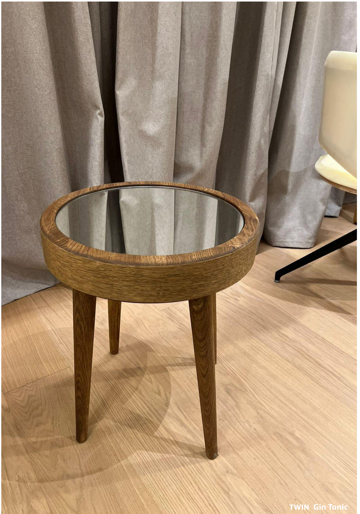
TWIN Gin Tonic